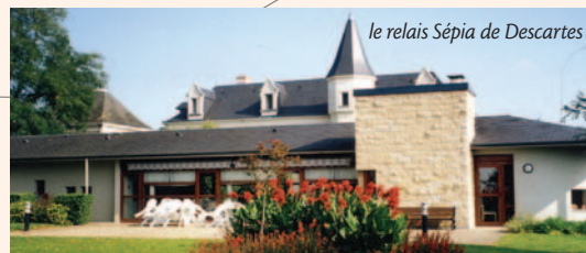
le relais Sépia de Descartes

Situés à Descartes et Savigné-sur-Lathan, les relais Sépia accueillent temporairement des personnes âgées qui vivent à domicile et qui rencontrent une difficulté momentanée pour y rester.