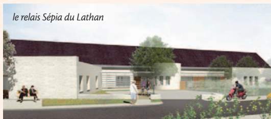
le relais Sépia du Lathan

Situés à Descartes et Savigné-sur-Lathan, les relais Sépia accueillent temporairement des personnes âgées qui vivent à domicile et qui rencontrent une difficulté momentanée pour y rester.