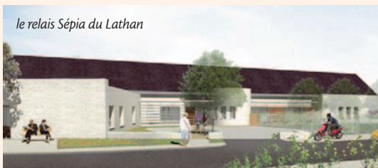
le relais Sépia du Lathan

Situés à Descartes et Savigné-sur-Lathan, les relais Sépia accueillent temporairement des personnes âgées qui vivent à domicile et qui rencontrent une difficulté momentanée pour y rester.